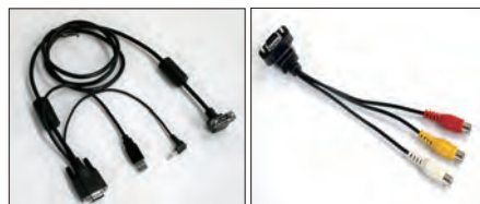
写真左:専用VGAケーブル 写真右:専用AVケーブル

PC入力(D-sub 15ピン)以外にビデオ入力(RCA2系統)にも対応し、柔軟で自由な運用が可能。専用ケーブルの排他接続によってシンプルに使いこなせ、配線もすっきりします。