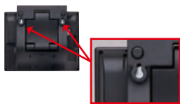
直接壁掛けが可能な取付穴