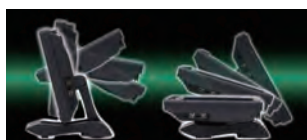
デュアルヒンジスタンドのモーションイメージ

クイックサン8.0インチ液晶ディスプレイの大きな特徴の一つ、「デュアルヒンジスタンド」。液晶画面を様々な角度に設定できます。QT-802シリーズのスタンドには直接壁掛けが可能な、メーカー独自の取付穴を装備しており、様々な用途・設置に対応できます。