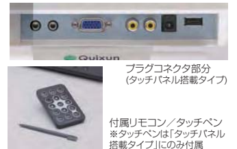
プラグコネクタ部分(タッチパネル搭載タイプ)

PC入力は高解像度XGA(画素数1024×768)対応のD-sub15ピン端子接続、ビデオ入力はRCA端子接続対応です。またスピーカー内蔵式、専用リモコン付属ですので、より柔軟で自由な運用が求められるショップやエントランス、イベント会場などでの設置に最適です。